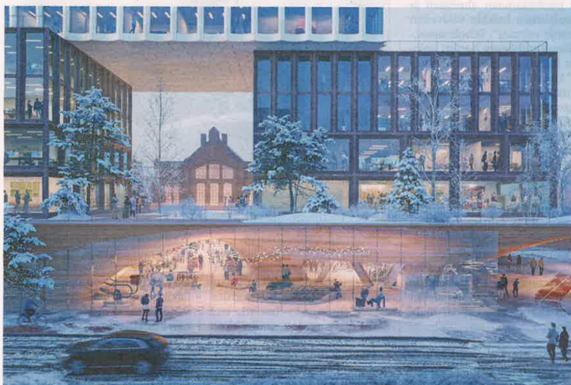
Ulkokoroketta kehitettäessä pitäisi tuomariston mukaan huomioida sääolosuhteet ja katumelu.